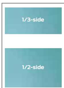
1/2-side, 183 × 132 mm 1/3-side, 183 × 87 mm