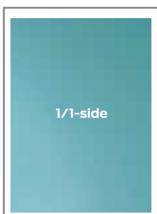
1/1-side, 183 × 268 mm Utfallende, 210 × 297 mm + 5 mm